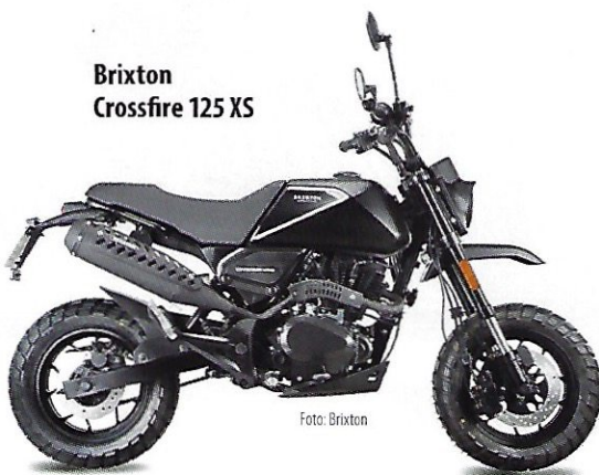
Brixton Crossfire 125 XS

Mit der Crossfire 125 XS hat nun auch Brixton, Eigenmarke der österreichischen KSR Group, ihr Mini-Bike am Start. Das Fun-Gerät, das sich auch für Wohnmobilisten oder „Yachtler“ eignen dürfte, kostet unter 2.000 Euro und leistet 11 PS (8 kW). Genug für den morgendlichen Brötchen-Express.